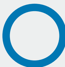
2. Taxonomiförenlighet hos investeringar, exklusive statliga obligationer*