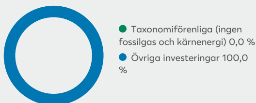
2. Taxonomiförenlighet hos investeringar, exklusive statliga obligationer*