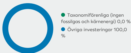
2. Taxonomiförenlighet hos investeringar, exklusive statliga obligationer*