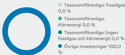
2. Taxonomiförenlighet hos investeringar, exklusive statliga obligationer*