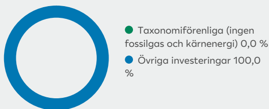
2. Taxonomiförenlighet hos investeringar, exklusive statliga obligationer*