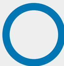
2. Taxonomiförenlighet hos investeringar, exklusive statliga obligationer*

● Taxonomiförenliga (ingen fossilgas och kärnenergi) 0,0 % ● Övriga investeringar 100,0 %