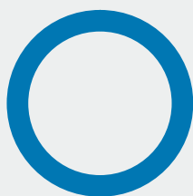
1. Taxonomiförenlighet hos investeringar, inklusive statliga obligationer*

● Taxonomiförenliga (ingen fossilgas och kärnenergi) 0,0 % ● Övriga investeringar 100,0 %