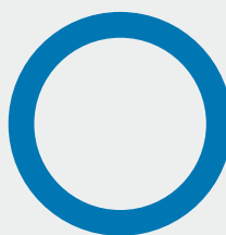
2. Taxonomiförenlighet hos investeringar, exklusive statliga obligationer*

● Taxonomiförenliga (ingen fossilgas och kärnenergi) 0,0 % ● Övriga investeringar 100,0 %