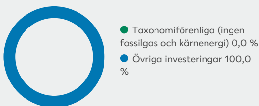
1. Taxonomiförenlighet hos investeringar, inklusive statliga obligationer*

De två diagrammen nedan visar i grönt minimiprocentandelen investeringar som är förenliga med EU-taxonomin. Eftersom det inte finns någon lämplig metodik för att avgöra hur taxonomianpassade statliga obligationer är*, visar den första grafen taxonomianpassningen med avseende på alla den finansiella produktens investeringar, inklusive statliga obligationer, medan den andra grafen visar taxonomianpassningen endast med avseende på de investeringar för den finansiella produkten som inte är statliga obligationer.