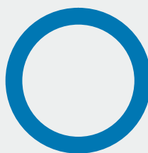
2. Taxonomiförenlighet hos investeringar, exklusive statliga obligationer*

● Taxonomiförenliga (ingen fossilgas och kärnenergi) 0,0 % ● Övriga investeringar 100,0 %