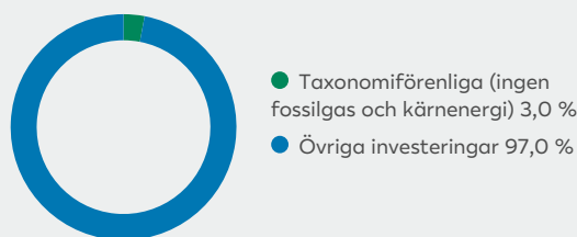
2. Taxonomiförenlighet hos investeringar, exklusive statliga obligationer*