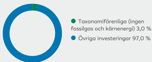
1. Taxonomiförenlighet hos investeringar, inklusive statliga obligationer*

De två diagrammen nedan visar i grönt minimiprocentandelen investeringar som är förenliga med EU-taxonomin. Eftersom det inte finns någon lämplig metodik för att avgöra hur taxonominpassade statliga obligationer är*, visar den första grafen taxonominpassningen med avseende på alla den finansiella produktens investeringar, inklusive statliga obligationer, medan den andra grafen visar taxonominpassningen endast med avseende på de investeringar för den finansiella produkten som inte är statliga obligationer.