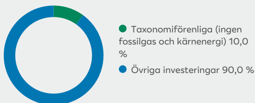
2. Taxonomiförenlighet hos investeringar, exklusive statliga obligationer*